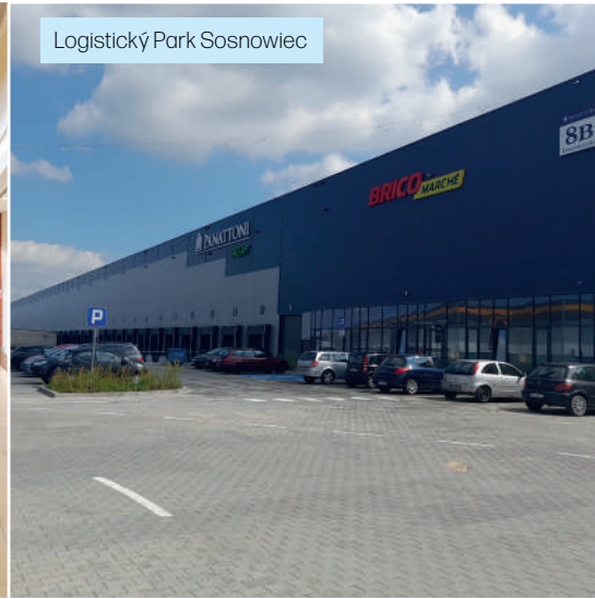
Logistický Park Sosnowiec