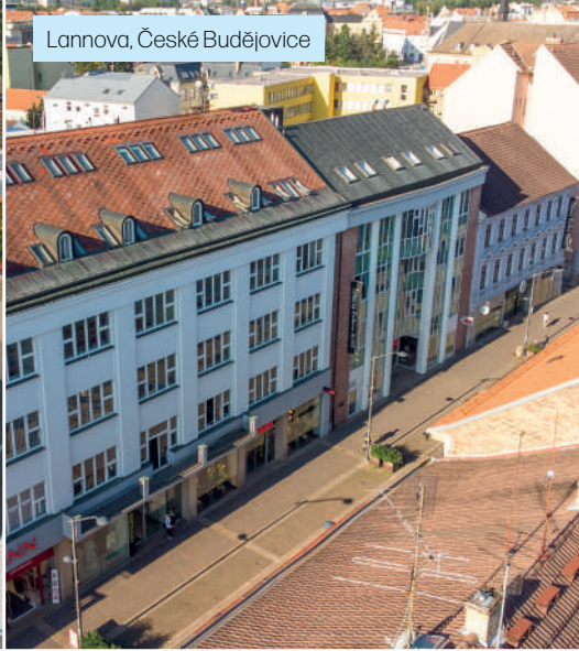
Lannova, České Budějovice