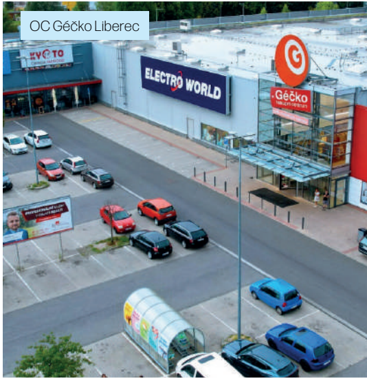
OC Gěčko Liberec