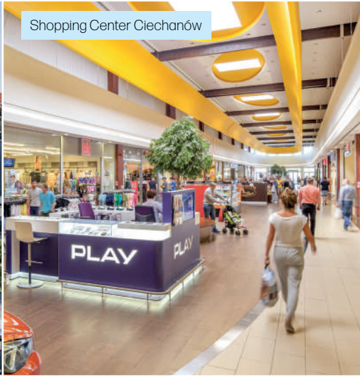
Shopping Center Ciechanów