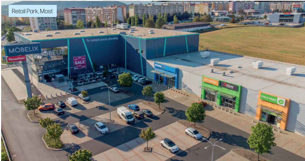
Retail Park, Most