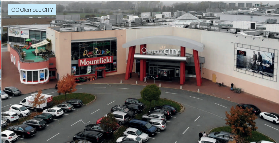
OC Olomouc CITY